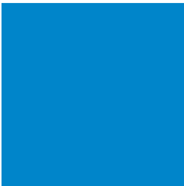
Pantone Process Blue C CMYK 100 / 13 / 1 / 2 RGB 0 / 133 / 202 # 0085CA